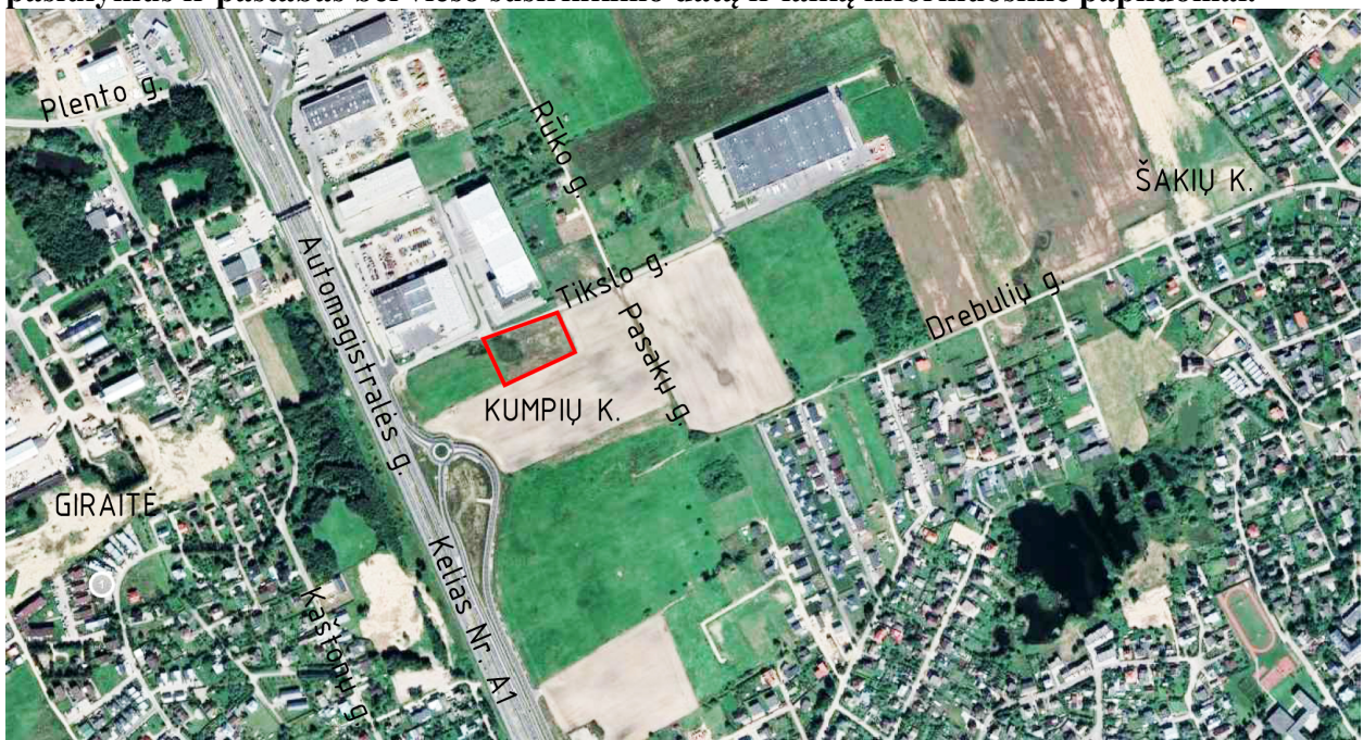
Planuojamo sklypo Tikslo g. 3, Kumpių k., Domeikavos sen., Kauno r.sav., situacijos schema

Apie galimybę susipažinti su detaliojo plano koregavimo sprendiniais, teikti motyvuotus pasiūlymus ir pastabas bei viešo susirinkimo datą ir laiką informuosime papildomai.